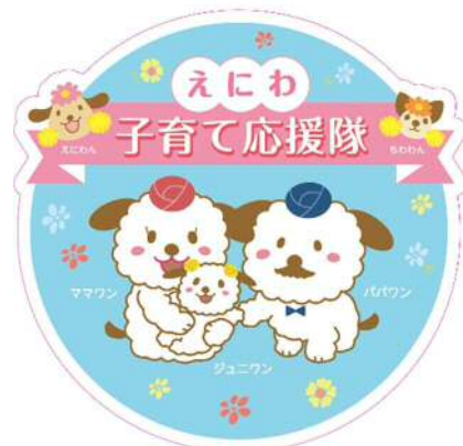
えにわ子育て応援隊協賛店舗の目印となるステッカー